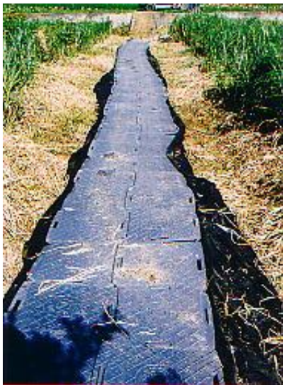
軟弱地への進入路として