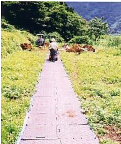
資材の運搬路として