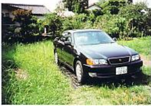
借地での仮設駐車場