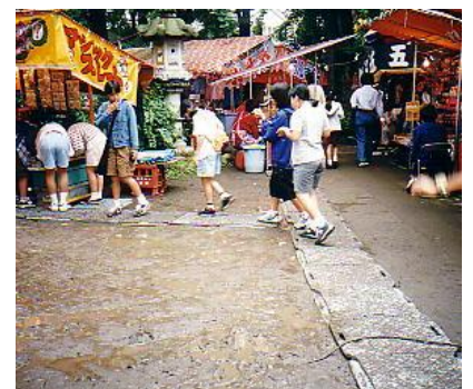
祭りの出店に使用