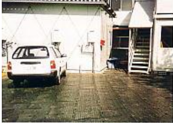
現場事務所の建物周辺に使用