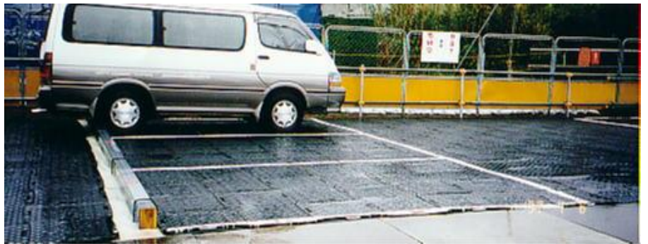
畑を利用した仮設駐車場として