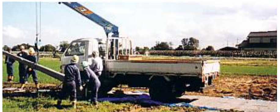
田んぼの中への車両進入路として