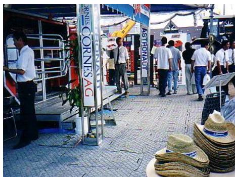
イベント会場のフロアとして