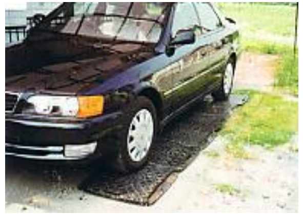
家庭でのカーポートに使用