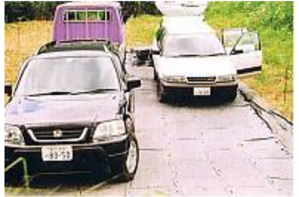
山間部の作業現場の仮設駐車場として